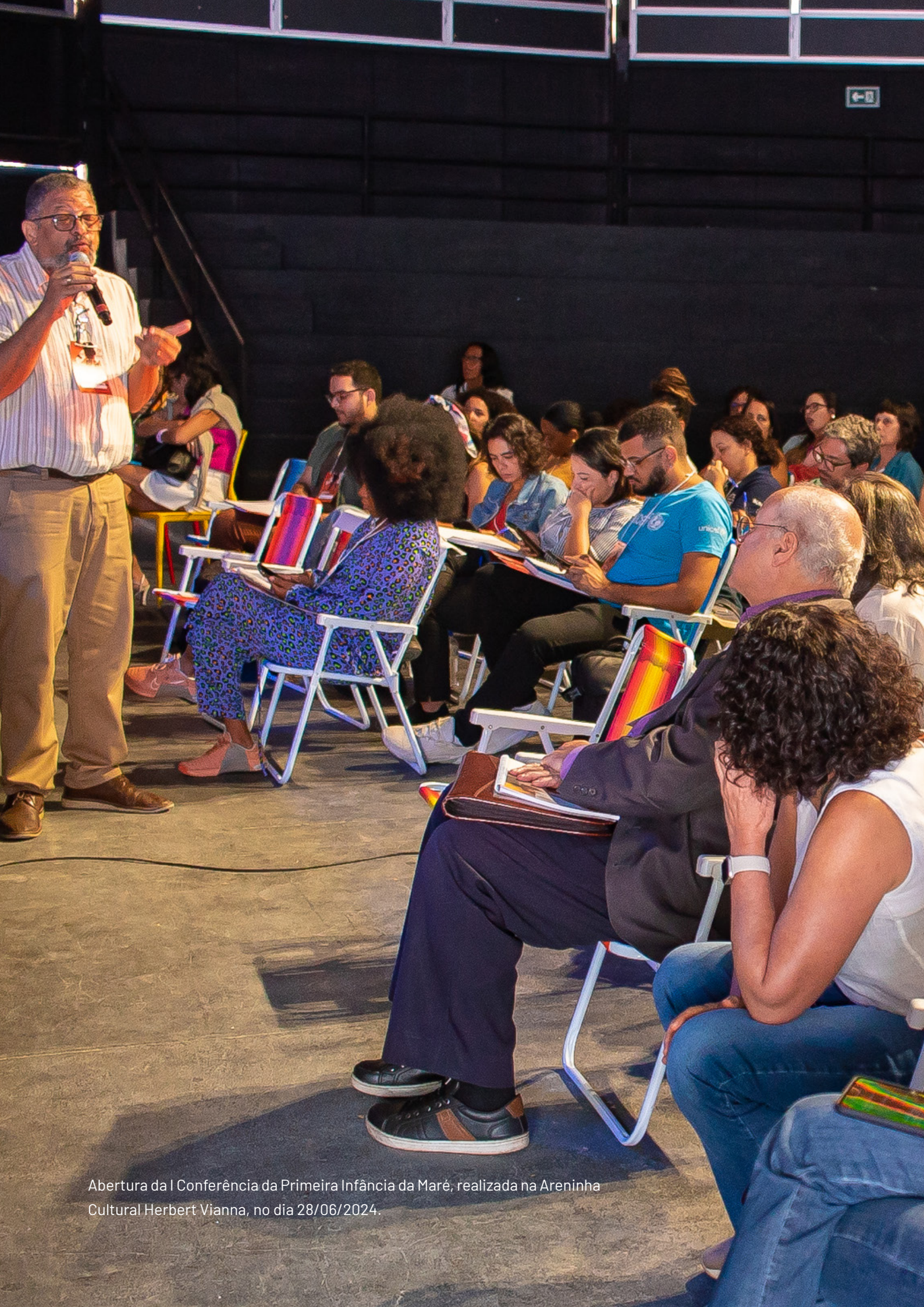
Abertura da I Conferência da Primeira Infância da Maré, realizada na Areninha Cultural Herbert Vianna, no dia 28/06/2024.