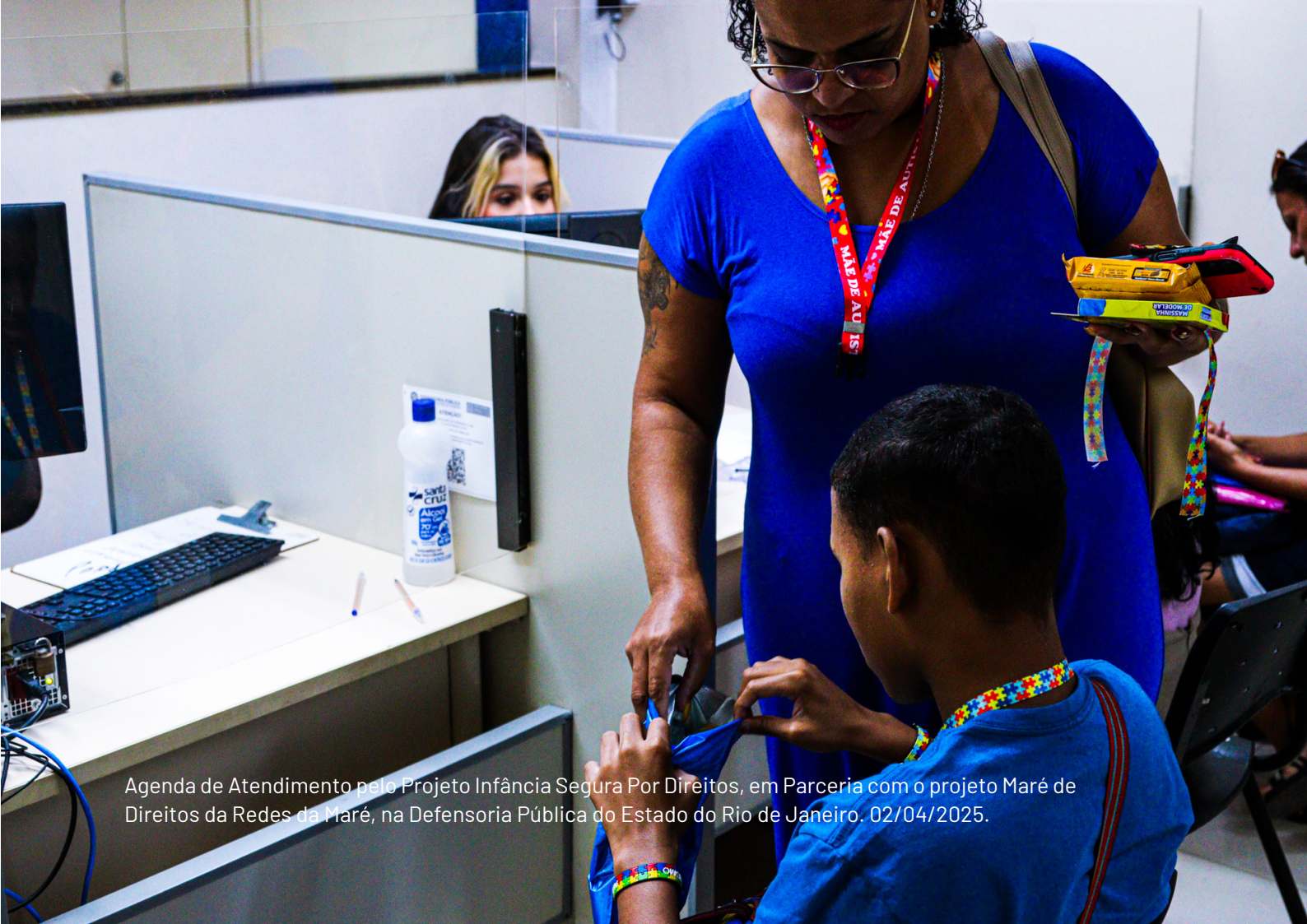
Agenda de Atendimento pelo Projeto Infância Segura Por Direitos, em Parceria com o projeto Maré de Direitos da Redes da Maré, na Defensoria Pública do Estado do Rio de Janeiro. 02/04/2025.