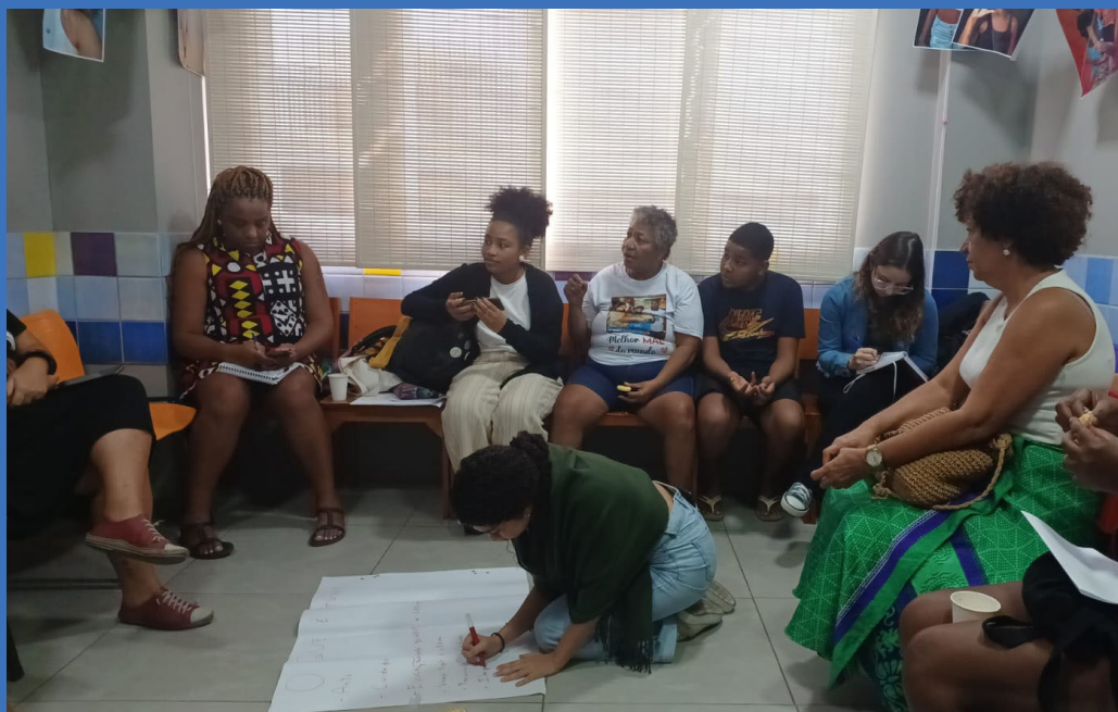
Grupo de Trabalho sobre Práticas de Cuidado, realizado durante a reunião do projeto Mulheres em Movimento na Casa das Mulheres da Maré, no dia 12/07/2024.