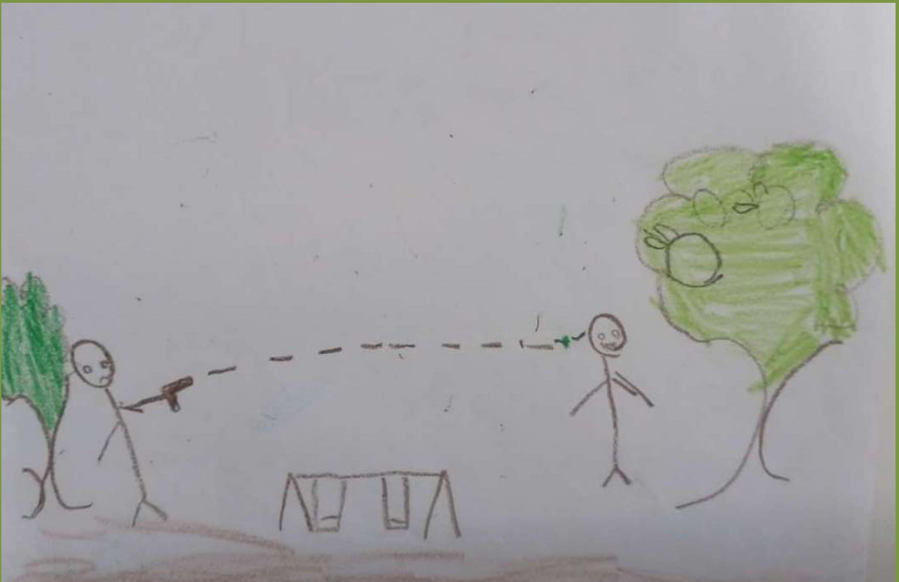
Desenho feito por criança durante a Oficina Direitos e Desejos- Situação de Violência- Biblioteca Jorge Amado, em 29/05/2024.