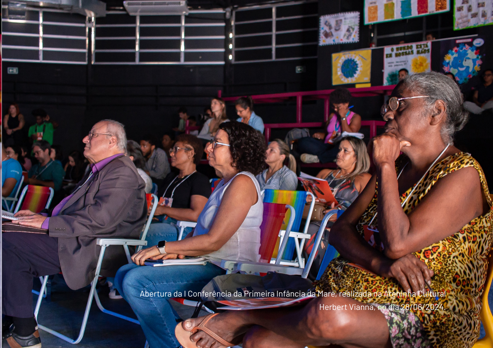
Abertura da I Conferência da Primeira Infância da Maré, realizada na Areninha Cultural Herbert Vianna, no dia 28/06/2024.