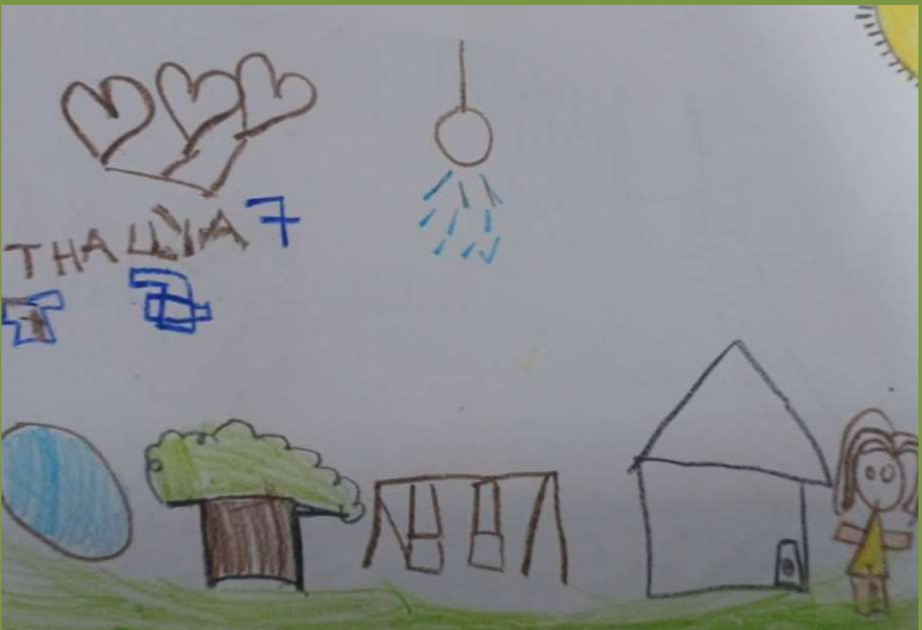
Desenho feito por criança durante a Oficina Direitos e Desejos- Praça Arborizada- Biblioteca Jorge Amado, em 29/05/2024.