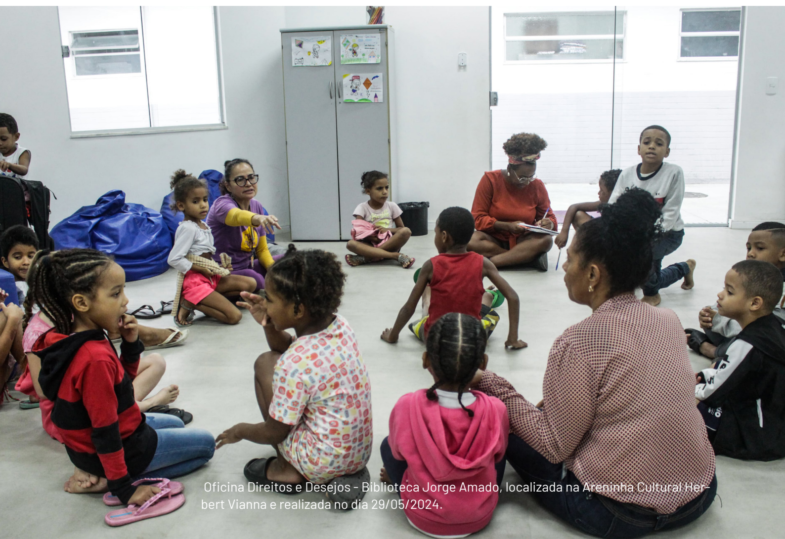
Oficina Direitos e Desejos - Biblioteca Jorge Amado, localizada na Areninha Cultural Herbert Vianna e realizada no dia 29/05/2024.

Consultadas sobre os problemas que identificam na Maré e os desejos que elaboram para uma vida melhor, 15 crianças (com idades entre 4 e 11 anos, sendo seis destas com idades entre 4 e 6 anos, compondo o grupo da Primeira Infância) expressaram: