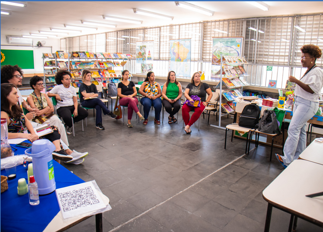
Agenda de Discussão com Escolas Municipais da Maré - Julho/2024