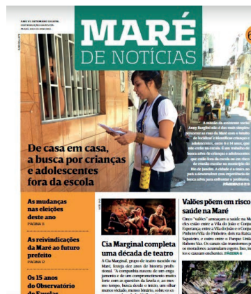
EDIÇÃO #69 Setembro/2016