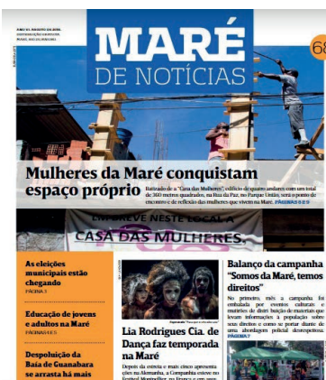
EDIÇÃO #68 Agosto/2016