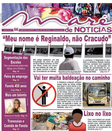
EDIÇÃO #66 Setembro/2015

http://redesdamare.org.br/publicacoes/mare-de-noticias/