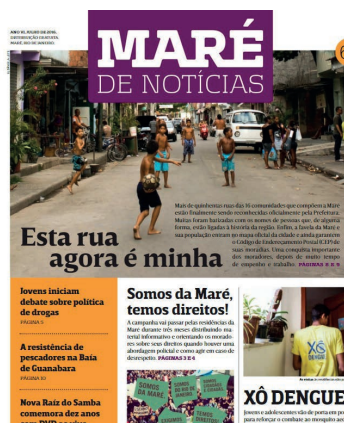
EDIÇÃO #67 Julho/2016 Nova versão